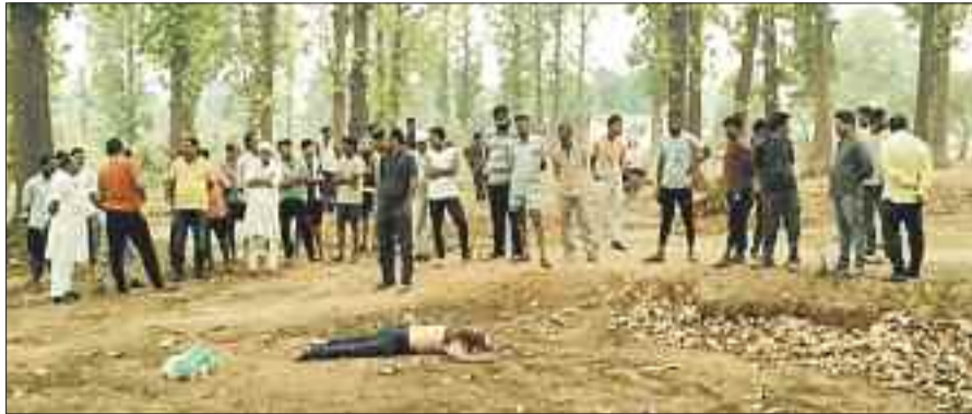
घटना स्थल पर लगी भीड़। इनसेट में मृतक।

गुरुवार की अलसुबह चनवारीडांड स्थित वन काष्ठागार के पीछे एक पत्रकार का रक्त रंजित लाश बरामद होने से क्षेत्र में सनसनी फैल गई। घटना की सूचना मिलते ही सिटी कोतवाली पुलिस मौके पर पहुंची और जांच पड़ताल में जुट गई है। मामले की जांच के लिए अंबिकापुर से फॉरेंसिक टीम भी पहुंची। समाचार लिखे जाने तक मामले में मृतक की पत्नी से पुलिसिया जांच पड़ताल जारी है।