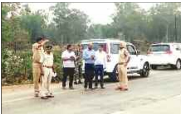
निरीक्षण करते अधिकारी।

राष्ट्रीय राजमार्ग क्रमांक 43 पर आए दिन होने वाली दुर्घटनाओं को देखते हुए ब्लैक स्पॉट के चिन्हांकन व सुरक्षा की दृष्टि से सुधार हेतु अधिकारियों ने निरीक्षण किया। एनएच के साथ ही स र गु जा