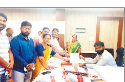
सभी 15 वार्डों में तीस प्रतिशत मतदातागण हुए कम

बिश्रामपुर। नगर पंचायत बिश्रामपुर के सभी पन्ध्र वार्डों में नए सिरे से मतदाताओं का सर्वे कर सूची जारी करने की मांग की लंकर भाजपाइयों ने सूरजपुर कलेक्टर से मुलाकात कर उनके समक्ष विस्तार से अपनी बातों को रखा और अपनी मांग के संबंध में उन्हें ज्ञापन सौंपा। ज्ञापन में उल्लेख है कि निकाय क्षेत्र में पूर्व में विगत 6 माह पूर्व हुए विधानसभा चुनाव एवं हाल ही में हुए लोकसभा चुनाव में नगरी क्षेत्र में मतदान का प्रतिशत निरंतर घटता ही जा रहा है। नगरीय निकाय क्षेत्र में लगातार मतदान प्रतिशत के गिरावट का मुख्य कारण बताया गया कि एएसडीएल क्षेत्र होने के कारण विभिन्न प्रतियों के लोग यहाँ निवास करते हैं, इनमें से काफी संख्या में कोलकमी ड्यूटी से सेवानिवृत्त होने के पश्चात अपने गृहग्राम चले गए हैं या फिर अन्य पंचायत क्षेत्रों में अपना निजी मकान बनाकर निवासरत हैं, अब उनके यहाँ नहीं रहने के