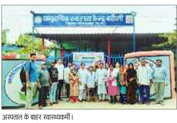
अस्पताल के बाहर स्वास्थ्यकर्मी।

राष्ट्रीय डेंगू दिवस पर स्वास्थ्य विभाग द्वारा जागरूकता अभियान चलाया गया। इस दौरान स्वास्थ्य विभाग की ओर से जागरूकता रैली, बैठक व सोर्स रिडक्शन गतिविधियों समेत अन्य कार्यक्रम किए गए। गुरुवार को कलेक्टर के मार्गदर्शन एवं मुख्य चिकित्सा एवं स्वास्थ्य अधिकारी के निर्देशानुसार राष्ट्रीय वेक्टर जनित रोग नियंत्रण कार्यक्रम के अंतर्गत