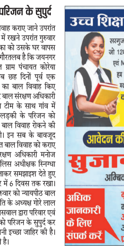
नाबालिग लड़की को सखी सेंटर से किया गया परिजन के सुपुर्द