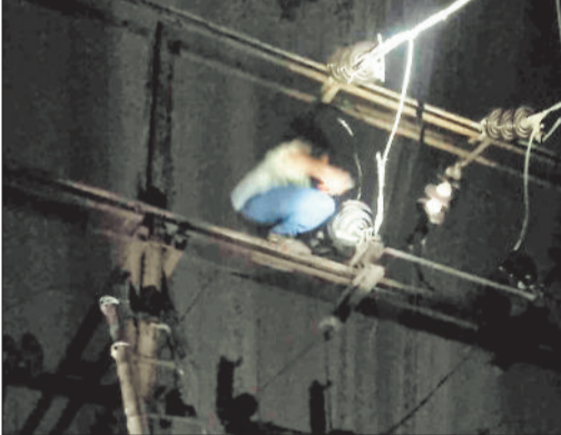
उप केन्द्र में मरम्मत करता विद्युतकर्मी