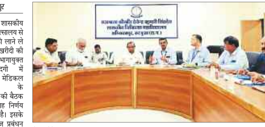
बैठक लेते संभागयुक्त व अन्य।