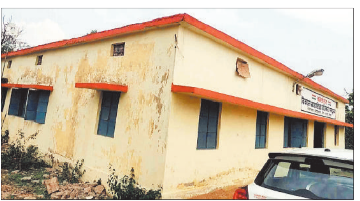
बीईओ कार्यालय रामानुजगर।

सरकार द्वारा पुरानी एवं जर्जर शासकीय कार्यालयों को मरम्मत, रंग रोगन कर चकाचक कर नये व आधुनिक स्वरूप में बदलने का प्रयास किया जा रहा है जिसके लिए आ व र य क ता अरुण राशि स्वीकृत प्रदान की जा रही है। हैरानी की बात यह है कि मरम्मत के तीन महीने बाद ही दीवार की हालत दयनीय हो गई। आलम यह है कि बरसात आने से पूर्व ही कार्यालय की दीवारों में किए गए रंग रोगन उखड़ने लगी है। ऐसे में सहज ही अंदाजा लगाया जा सकता है कि कार्यालय मरम्मत में किस तरह के मटेरियल व गुणवत्ता का ध्यान दिया गया है।