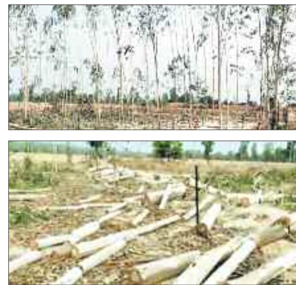
काटे गए पेड़।