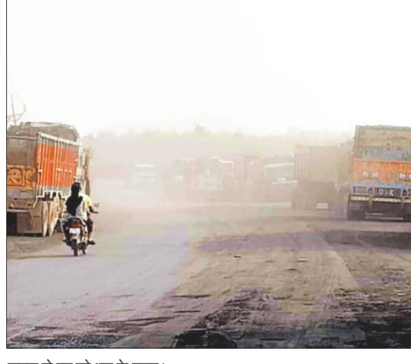
सड़क से उड़ रहे धूल के गुबार।