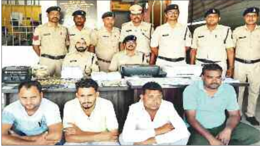
पुलिस गिरफ्त में आरोपी जब जाली नोटन व अन्य सामान।