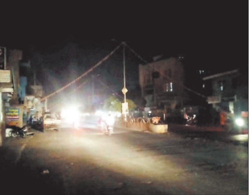
शहर की अधेरी सड़क।